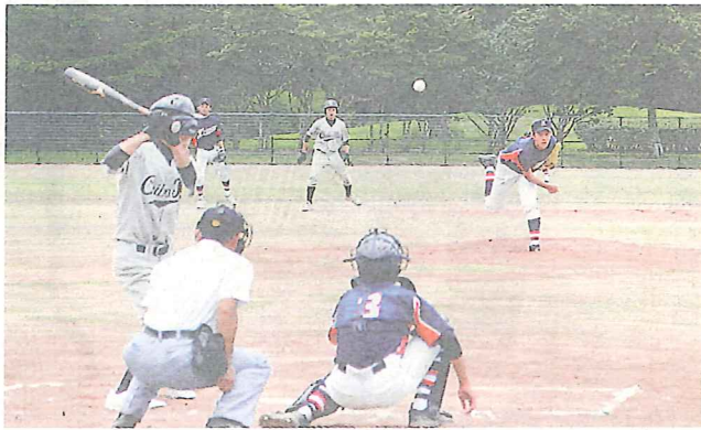
被災地の宮城と福島を招いて行われた絆甲子園=千葉市若葉区のとれた徳寺大グラウンドで